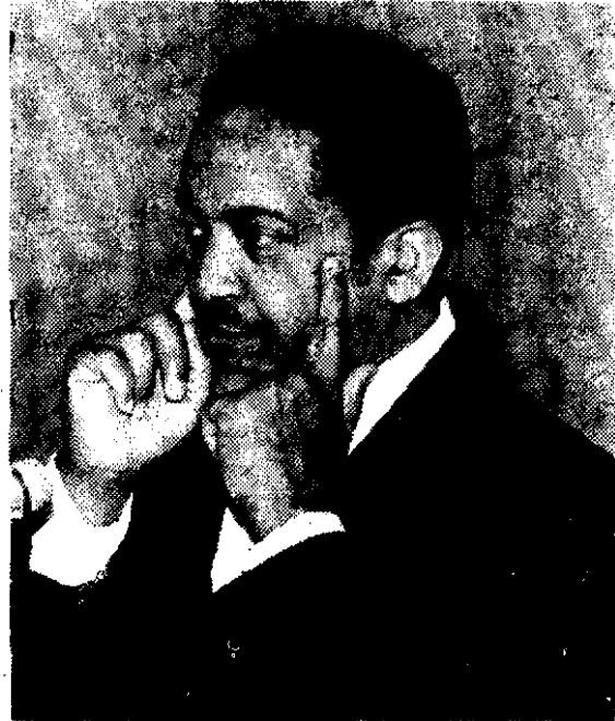
The Honorable W.D. Muhammad

De Weleerde heer Master Elijah Mohammad leidde de groeiende Moslimgemeenschap in Noord-Amerika naar het bedrijfsleven. Niet zomaar een bedrijfsleven waar alles wat de klok sloeg "winst" was, maar een bedrijfsleven dat voldoening gaf aan de natuurlijke behoeften en wensen van een religieuze Moslim gemeenschap. Zijn bekende roep "Doe iets voor je zelf" resulteerde in het vestigen van zaken als bakkerijen, supermarkets, restaurants en manufacturen winkels in vele Moslimgemeenschappen. Deze zaken waren van vitaal belang, omdat zij in de werkelijke fysieke behoeften van de Moslims voorzagen,